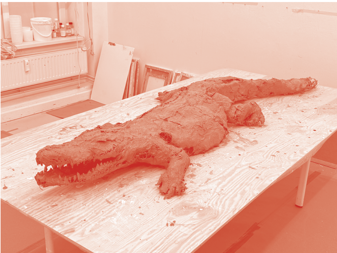
The earliest Crocodylian, circa 95 million years ago, 2024

år siden, 2.000 år siden. Krokodillerne fremtræder på én gang naturalistiske og kunstige. De har processuelle spor fra deres fysiske tilblivelse, en tilstand, som de på en måde stadig er i. På trods af deres modelkarakter har de også, som de arkaiske jagtdyr de er, en slumrende vildskab i sig, og virker både truende og truede. I krokodillerne kortsluttes tidens lineære bevægelse fra fortid til nutid, og en anden langsommere og anakronistisk tidshorisont kommer til syne, i kontrast til nutidens 24/7-ikketid.